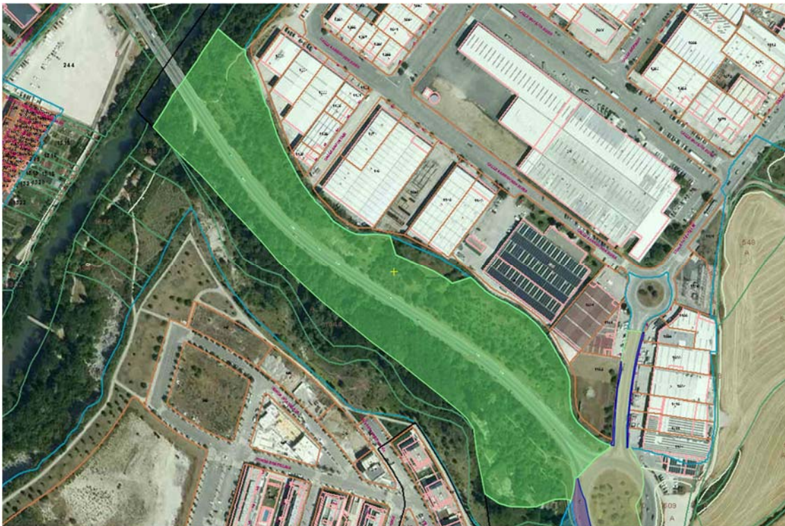
Figura nº 3: Detalle del catastro en el tramo nº 4, carretera NA-2306