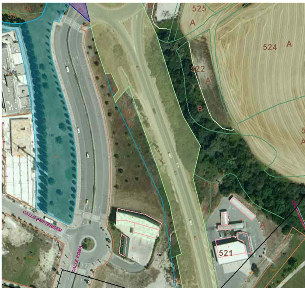
Figura nº 1: Detalle del catastro en el tramo nº 3, carretera NA-2300

La actuación de este tramo se desarrolla en suelo perteneciente a la franja de protección de la carretera, por lo que no se afecta al planeamiento urbanístico existente, como se aprecia en la figura nº 1.