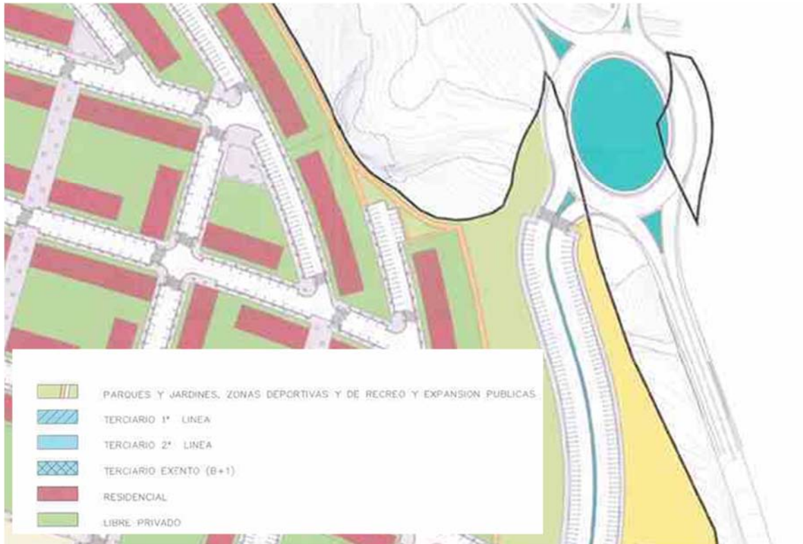
Figura nº 2: detalle de plano de usos del suelo del PSIS de Ripagaina

La ocupación de proyecto en el entorno de la glorieta de intersección con la Calle Roma, carreteras NA-2300, NA2306 y acceso al Polígono Industrial de Areta no modifica el planeamiento urbanístico al tratarse de suelo destinado a zonas verdes, tal y como puede observarse en la figura nº 2, detalle de plano de usos del suelo del PSIS de Ripagaina.