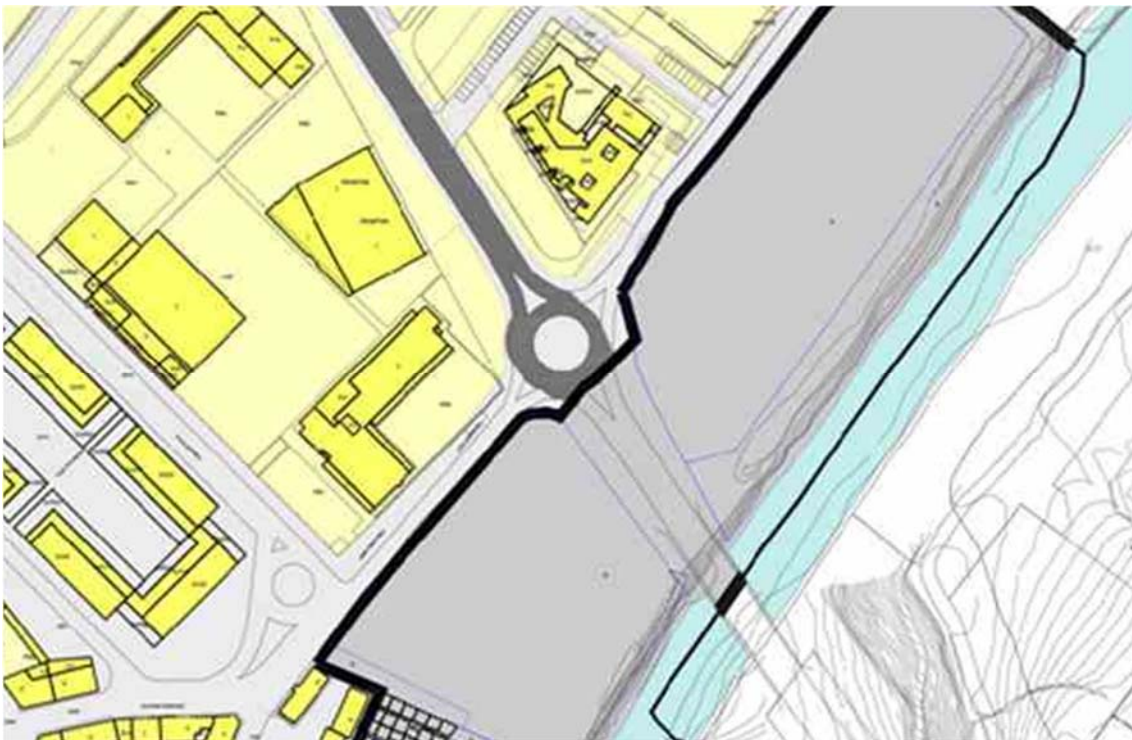
Figura nº 4: Detalle del Plan Municipal de Burlada. Clasificación y categorización del suelo

Respecto al último área analizada, la glorieta en el Término Municipal de Burlada, como se observa en la figura nº 4, detalle del Plan Municipal de Burlada, plano de Clasificación y categorización del suelo, la actuación objeto del presente proyecto se desarrolla en suelo urbanizado consolidado.