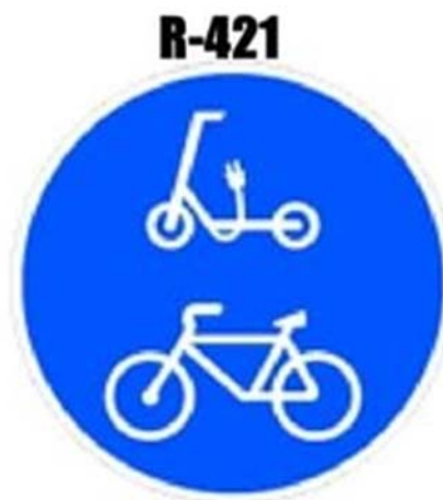
Figura nº 2: Señal R-421 Vía reservada y obligatoria para ciclos y para vehículos de movilidad personal

El carril bici contará con señalización horizontal formada por dos líneas blancas continuas exteriores de anchura 10 cm y una línea central discontinua de espesor 10 cm. de separación entre los dos sentidos de circulación ciclista. Los inicios y finales de los distintos tramos de carril bici, así como sus principales conexiones se señalarán con la correspondiente señal vertical indicativa de carril bici (itinerario ciclista obligatorio, ver figura nº 2).