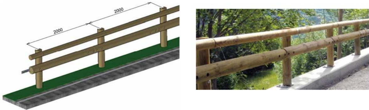
Figura nº 3: barrera de protección peatonal en acera en NA-2300

Por último, en el entorno de la glorieta de Areta se dispone una barandilla similar a la anterior pero específica para límites de carriles bici (ver figura nº 4).