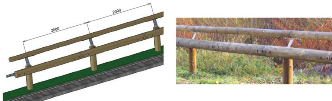
Figura nº 4: barrera de protección ciclista proyectado en Glorieta Areta.

Por último, en el entorno de la glorieta de Areta se dispone una barandilla similar a la anterior pero específica para límites de carriles bici (ver figura nº 4).