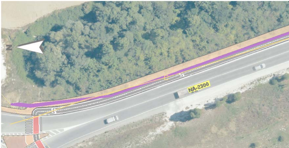
Figura nº 1: detalle de la canalización de MT en los planos de nº 8 de proyecto.

Previsiblemente las piedras de escollera no afectarán a la canalización eléctrica, pero se incluye una partida para la protección de la canalización mediante solera de hormigón.