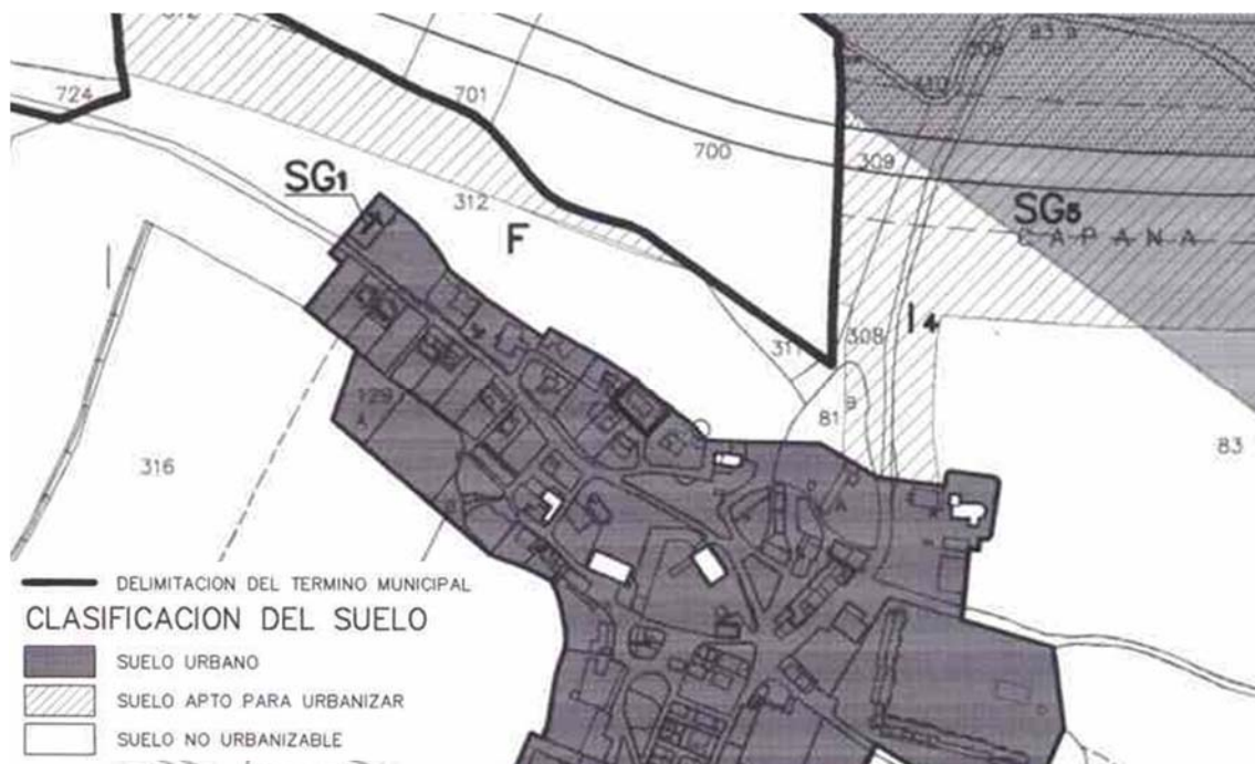
Figura nº 2: Detalle del Plan Municipal de la Cendea de Cizur Menor.