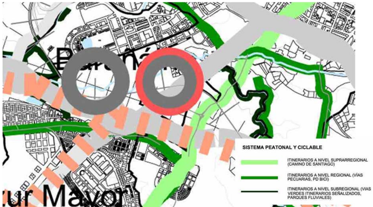
Figura nº 1: Detalle del plano de infraestructuras (5.1) de las POT.

Tal y como se puede apreciar en la figura nº1, las POT (Planes de Ordenación Territorial de Navarra) cataloga el primero de los tramos objeto del presente proyecto como Itinerario peatonal y ciclable a nivel suprarregional (camino de Santiago).