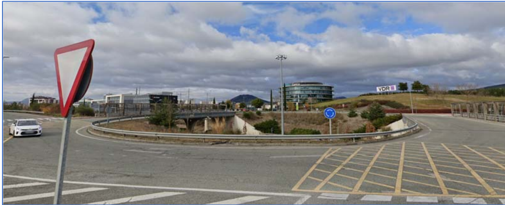
1. Glorieta sobre PA-30

Las fotografías recogidas a continuación siguen el sentido de avance del eje de proyecto.