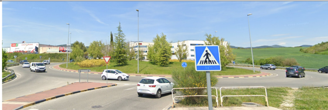
8. Glorieta de acceso al polígono de Areta, vista desde la Calle Roma.