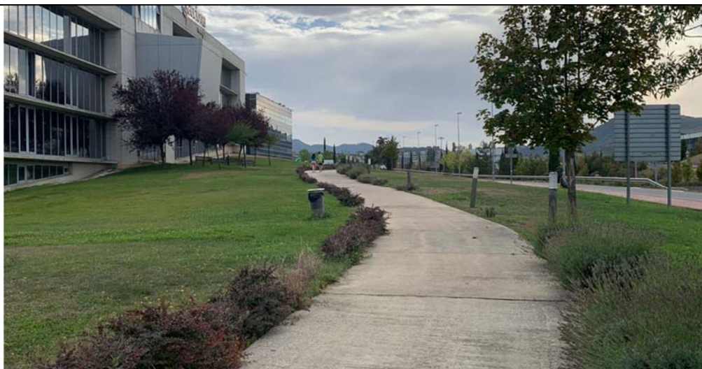
3. Senda perimetral Sur de la Ciudad de la Innovación