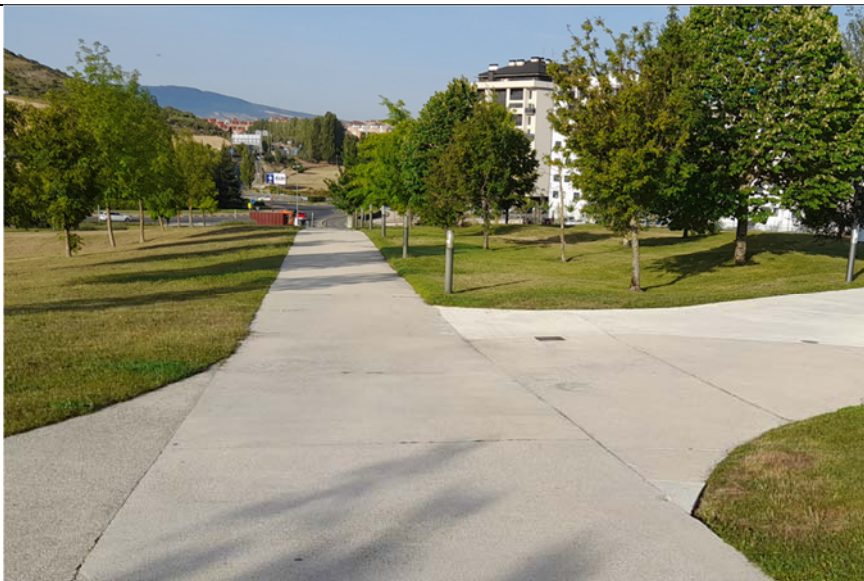
4. Senda peatonal entre la Avenida Ciudad de la Innovación y la pasarela peatonal