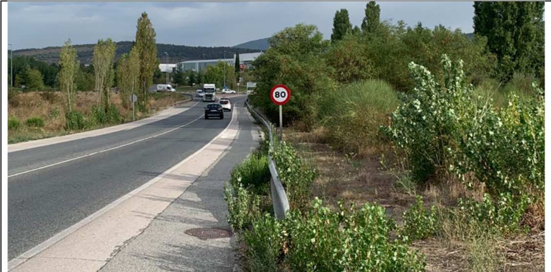
7. Vista general de la margen