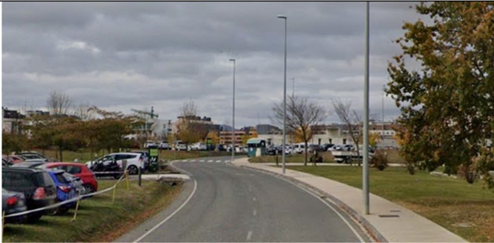
2. Avenida Ciudad de la Innovación