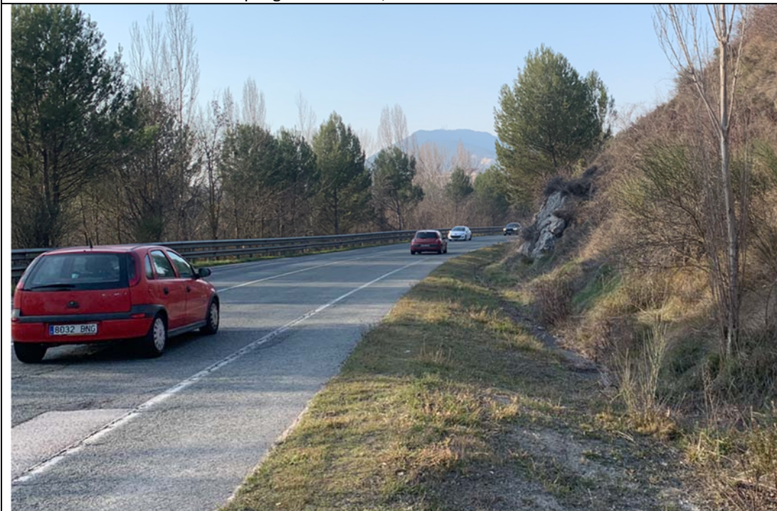
9. Carretera NA-2306