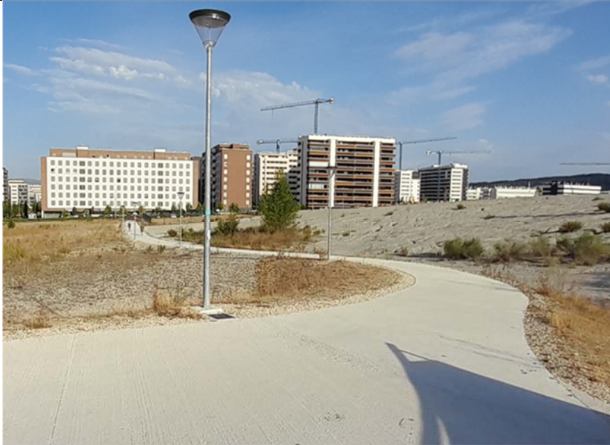
13. Senda peatonal de conexión con la pasarela en la margen de Ripagaina