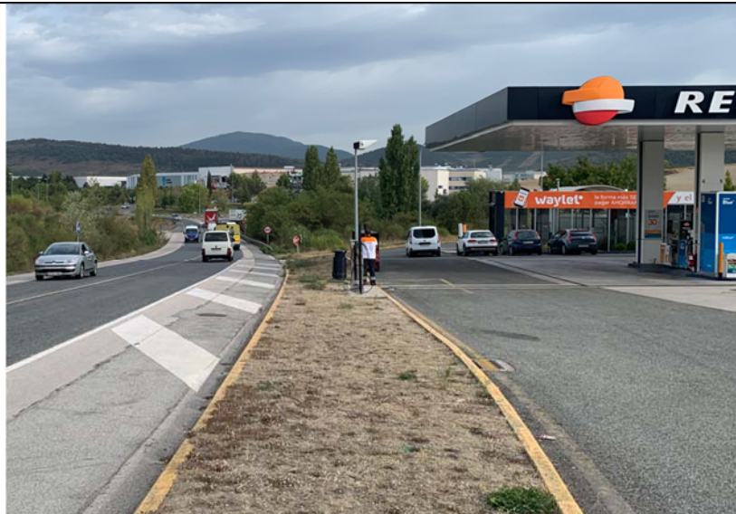
6. Estación de Servicio Elomendi en la Carretera NA-2300