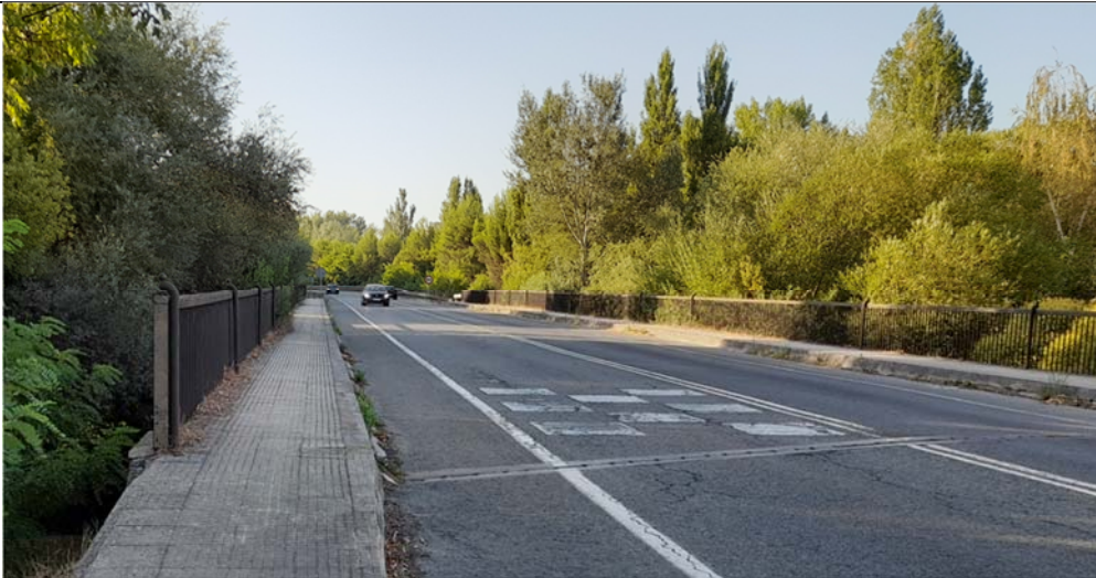
10. Viaducto de la Carretera NA-2306 sobre el Río Arga