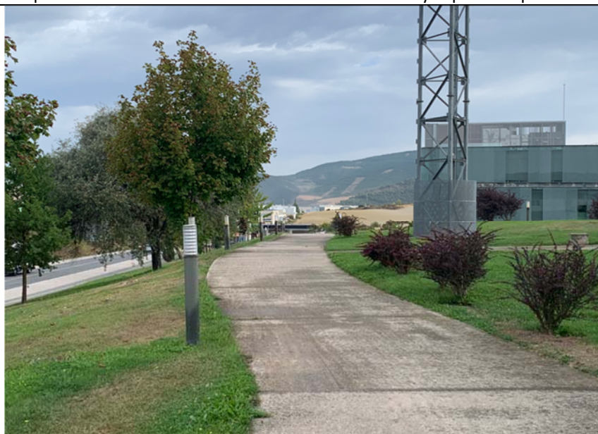
5. Senda peatonal de la Ciudad de la Innovación coincidente con el tramo 3 de proyecto