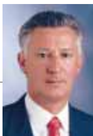
José Ignacio Palacios Zuasti Consejero de Obras Públicas, Transportes y Comunicaciones del Gobierno de Navarra

U na mención especial es la que se hace a la colaboración que la Dirección General de Obras Públicas realiza con los Ministerios de Fomento y de Medio Ambiente en los ámbitos de las obras hidráulicas y del transporte ferroviario y aeroportuario. Gracias a esa colaboración Navarra va a conseguir mejorar su conexión con las grandes ciudades de España y que proyectos como el Embalse de Itoiz y el Canal de Navarra sean pronto una realidad de cuyos beneficios disfrutarán los ciudadanos navarros.