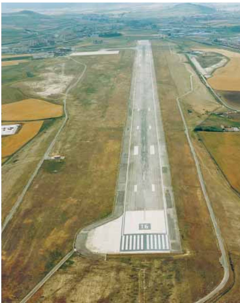
Imagen de la pista de aterrizaje de Noain-Pamplona captada en 1995.

Durante el año 2000, AENA inició la redacción del Plan Director que definirá las actuaciones que deberán desarrollarse en el aeropuerto. Las previsiones de obras planteadas para los años 2001, 2002 y 2003 por parte de AENA y del Ministerio de Fomento alcanzan un importante volumen económico.