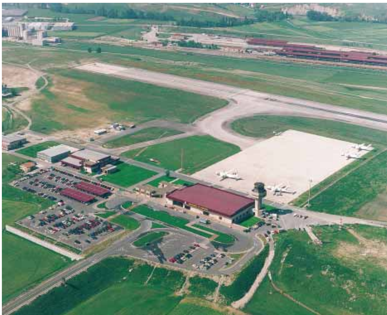
Mayo 1997. Edificio Terminal, estacionamiento de aeronaves y sus instalaciones anejas.

Las principales características del tráfico aéreo en Pamplona-Noáin son la gran regularidad, el uso de aeronaves de tipo regional, la práctica ausencia de tránsitos y la baja componente de tráfico internacional.