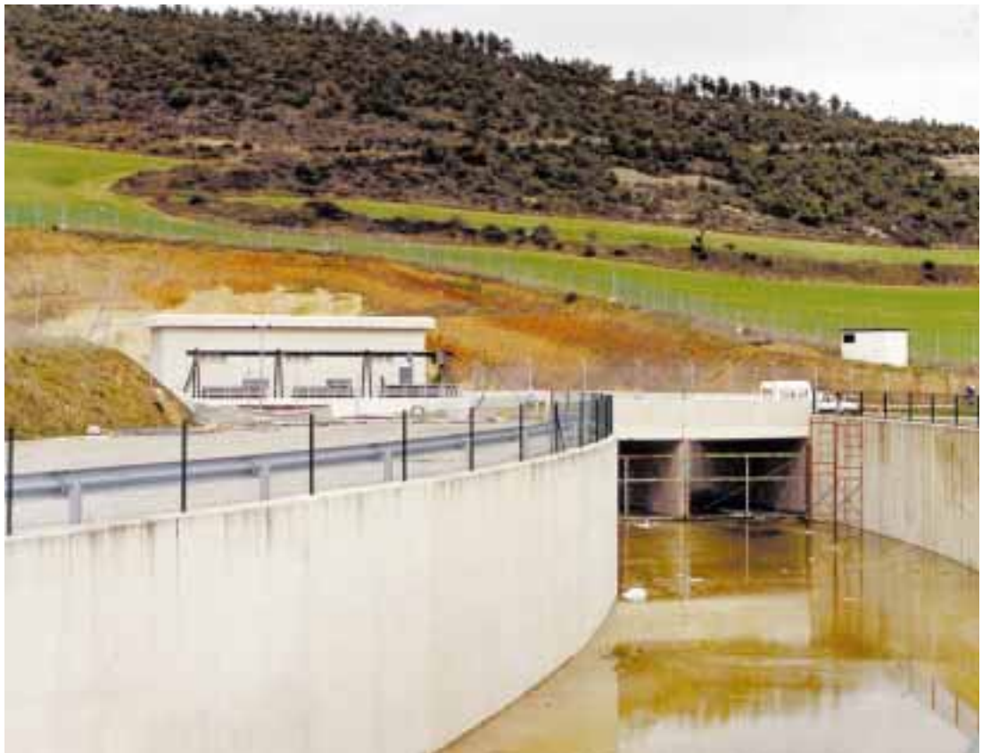
Embalse de Itoiz: Inicio del Canal de Navarra. [Foto 3]

En lo que corresponde al Gobierno de Navarra las principales actuaciones han sido las siguientes: