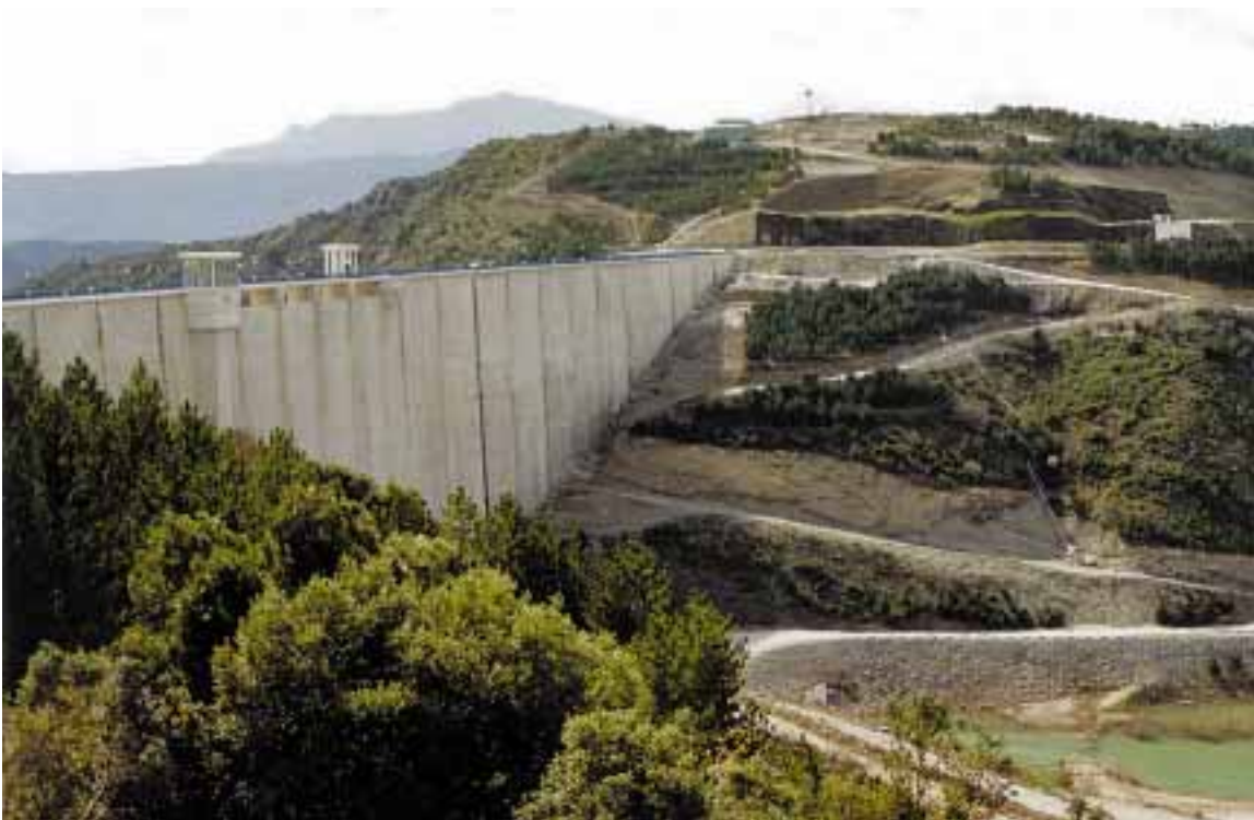
Presa de Itoiz: Vista desde aguas arriba. [Foto 2]

En esa fecha, se estaban realizando los siguientes trabajos: