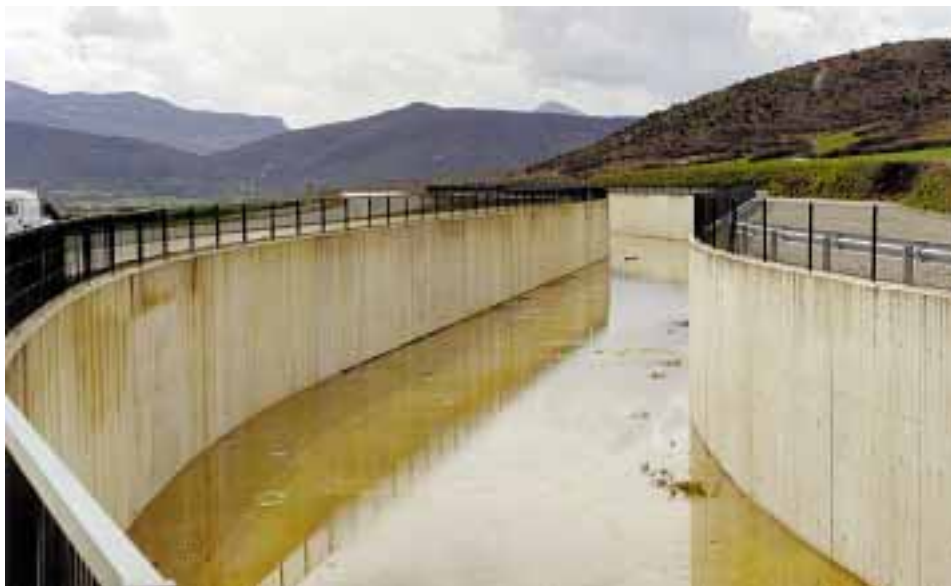
Canal de Navarra, Tramo 0. [Foto 4]

6) En cuanto a las actuaciones correspondientes a la Comunidad Foral de Navarra, de acuerdo con el Convenio, cabe destacar lo siguiente: