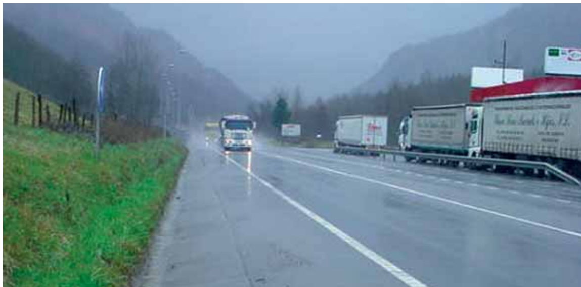
Autorizaciones de Transporte por Carretera. Navarra 2007